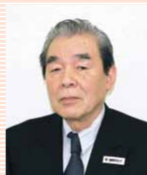
複合地区 年次大会 大会会長