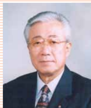
334複合地区 ガバナー協議会・議長