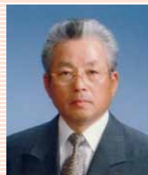
複合地区 年次大会 大会委員長