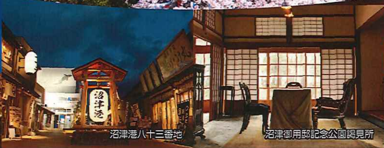
沼津港八十三番地